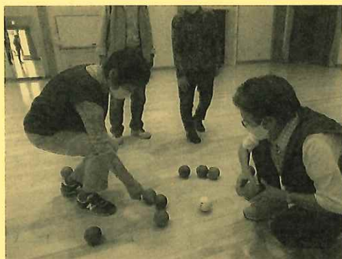
(ポッチャの様子、新狭山公民館にて)

現在活動3年目で、13名が在籍しています。それぞれが都合の良い時、体調の良い時に無理なく参加しています。会費は年間千円程度です。