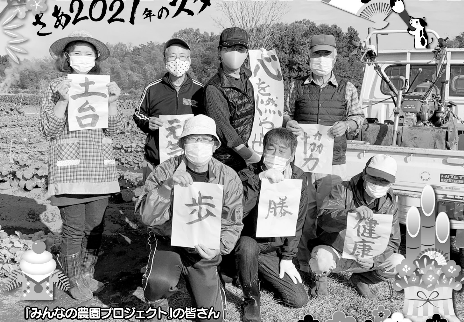
『みんなの農園プロジェクト』の皆さん