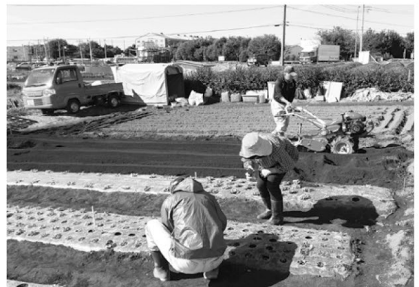
農業の達人に教わるのもまた楽し!