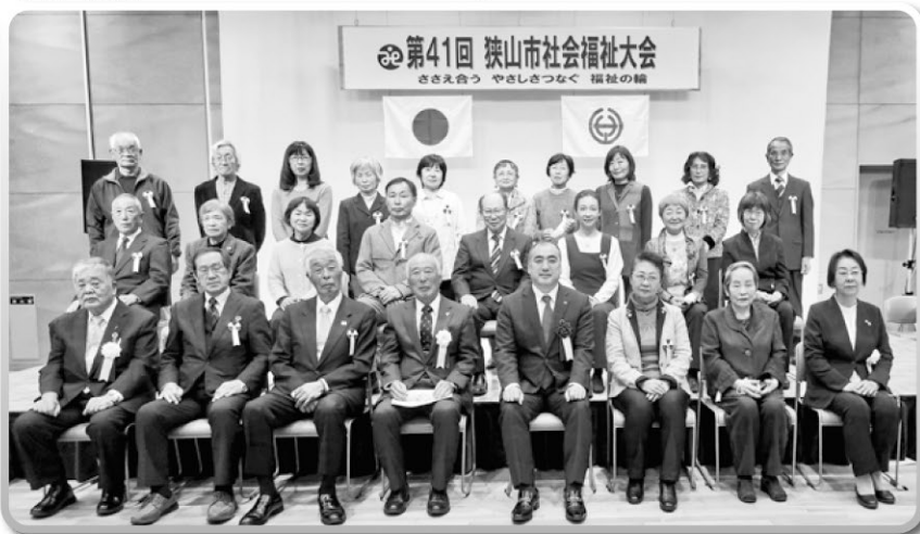
※撮影時のみマスクを外しています