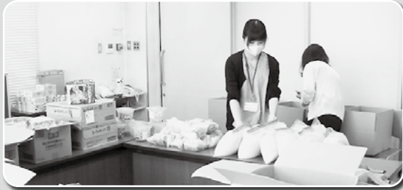
大学生向け「食の応援プロジェクト」で食料を送付します。