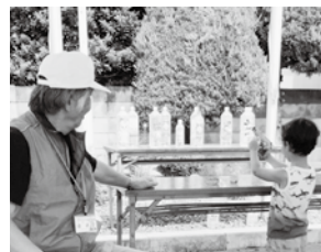
的の狙い方を教わりながら無心で撃つ男児