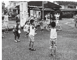
小学生もいっしょに