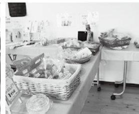
食事だけでなく買物も出来ます