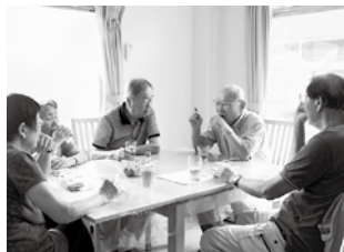
食事を待つのも楽しいひととき

「年齢を問わず交流が出来る新しい形のたまり場でありたいと願っています」の言葉が印象的でした。