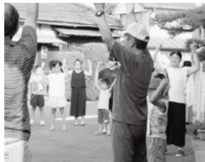
元気にみんなでラジオ体操

ラジオ体操が終わると子ども達がサッと並びます。カードに印をもらうためです。ハンコを押してもらおうと、ニコニコしながら家に向かいました。