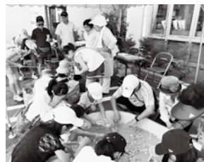
器いっぱいになったスーパーボールを数え「41個もあった!」と喜ぶ女兒も

一斉に好きな横丁へ駆け出します。特に水遊び横丁は、子どもだけでなく父母や参加ボランティアをも一瞬に童心に戻します。時々干上がった駐車場にホースシャワーが降ると歓声があがり、老いも若きも涼を得た交流の場でした。