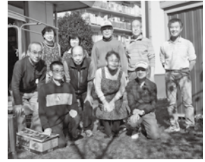
スタッフのみなさん