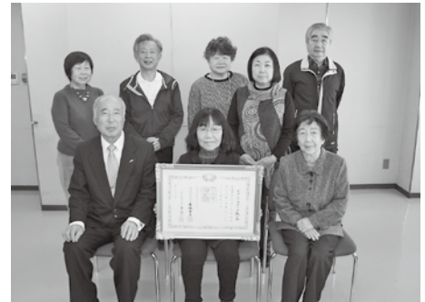
▲これまで協力してくださった地域の皆様のおかげ...と受章を喜ぶ「綾の会」のメンバー

自ら進んで社会に奉仕する活動に従事し徳行顕著な個人または団体(当該事績に関する大臣表彰または知事表彰を受けている者)に授与される。