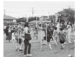
竹馬、おもしろそう、できるかな？