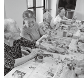
とてもカラフルなお花が勢ぞろい