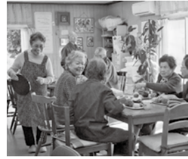
この日を楽しみにしていました