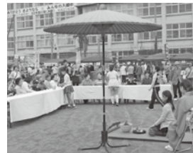
お茶の里のお茶会です

フラダンスなどが繰り広げられていました。にぎやかな声が秋空にひびき、老若男女それぞれが、楽しい休日をご過ごしていました。