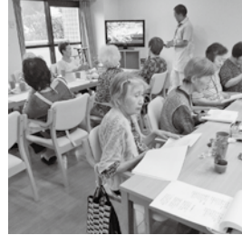
歌集を見ながら「北国の春」を皆で

未亡人になり一人息子を大学まで出したと話してくれた94才の方等こちらが逆に元気を頂きました。きびきびと働く7名のスタッフの方々にも感謝した取材でした。