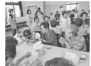
盛り上がるビンゴゲーム