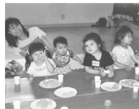
おやつは楽しいよ