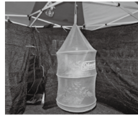
籠の中で光るホタルの群れ

会長は、これからも「ホタルのこを知る親子教室」などを開き、水辺を綺麗にし、カワニナやシジミが棲める環境を作り、ホタルの飛びかう街にしたいと語っていました。