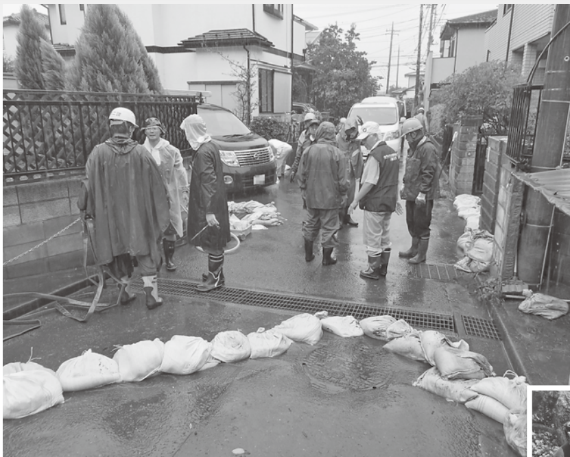
▲排水詰まりの除去