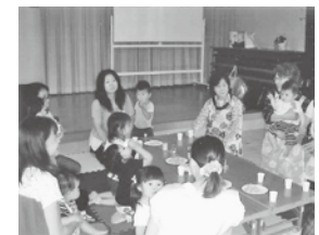
みんなで楽しく話します