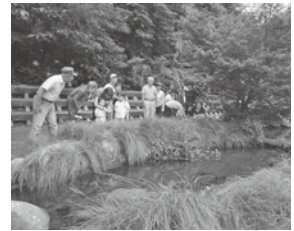
夕闇の中、ホタルを探す