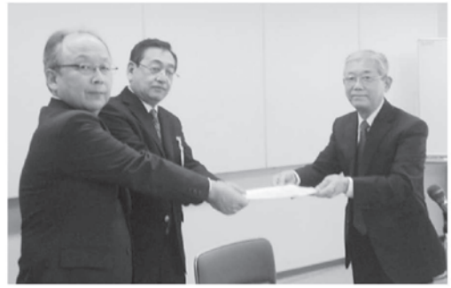
地域福祉推進会議より、市と社協に提言書が手渡されました。

この計画は平成 27 年度から平成 32 年度までを計画期間とし、地域住民のつながりを深めるとともにその幸せを高め、かつ地域福祉活動の輪を広げることを目的とした計画です。