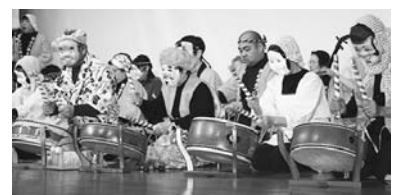
▲ 式典の様子 (昨年度)