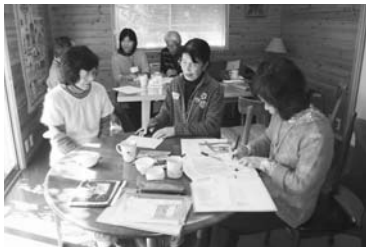
▲「たすけあい」相談室

地元育ちがほとんどいない当狭山台中央自治会で、会員相互の交流を図るにはどうしたら良いのか、その対策について検討がなされてきました。一緒にお茶を飲むだけでは継続は難しい、共に目的を持って集えばそれが媒介となり交流が自然体で出来るのではないか、平成24年12月に「たすけあい」活動が発足、間もなく満1年を迎えます。 一人では出来ない困りごとの手助け、例えば庭の草取りや障子貼りなどを行うことで会話も弾み、お互いが繋がり交流の輪が広がる。1件、2件とこなすうちに依頼者の口コミで件数が増えていきました。 現在スタッフ8名、手助け提供者19名で知り合いから知り合いへと活動の輪を広め、横の繋がりができ、10ヶ月の実績も40件と上昇カーブを描いています。また、たすけあいの場でも近所のお知り合いと言ったことで信頼も深まっています。 現在、レンタルハウスの一室を相談室として借り、活動も軌道に乗り始め、明るい見通しを感じています。