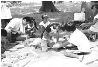
▲ 大人も子どもも一日大工さんに!!