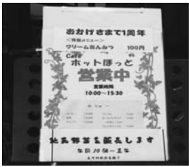
▲のぞいてみてください

東急台自治会集会所で、毎月第3月曜日に開いている「カフェ・ホットほっと」は、10月に1周年を迎えました。 ここでは、気軽に立ち寄り、お茶や軽食を取りながら地域の人達が交流することで、つながりが深まることを願って運営されています。 1周年の特別メニューは「クリームあんみつ」、各テーブルには、庭で咲いた季節の花が美しく飾られ、折り紙が、お土産として置かれていました。中には、ゲームをしながらおしゃべりを楽しむ人もいます。 高齢の方は、「家から近いので、歩いて来られます。一人で昼食を取るよりここに来た方が楽しい。」と笑顔で話していました。 赤ちゃん連れの方から高齢の方まで幅広い年代の方が集っていました。 11時を過ぎると老若男女問わず次々と人が増え、スタッフの人達も大忙しでした。