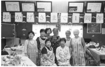
▲楽しい時を♪ 一緒に