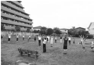
▲さわやかな空気を吸って

尚、この公園は、21日に除草され、28日には 盆踊りの予定です。櫓とテントが何梁も張られ ていました。