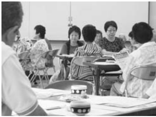
▲地域包括支援センター講師より手遊び学習…