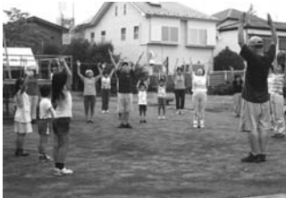
▲大人も子どもも元気いっぱい