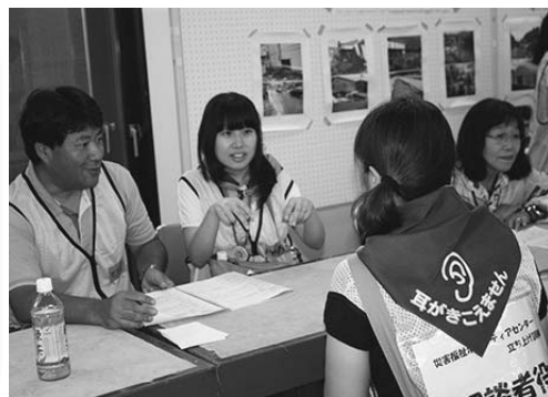
▲災害福祉ボランティアセンター立ち上げ訓練より

★11月1日（金）より、社会福祉協議会（社会福祉会館、東口事務所）で、狭山市在住・在勤の耳が聞こえない方、手話ができる方に無料で配布します。