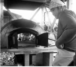
▲釜戸で最高のピザを！

水富地区にある心身障害者のための作業所「オアシス」の感謝祭へ行ってきました。オアシス作業所は、地域の開かれた交流の場として、馴染んでいきます。感謝祭へも、多くの方々が足を運んでいました。開会には、元気な太鼓に合わせて、踊りや手拍子でにぎわいました。そして、会場内では、手打ち蕎麦や、ひじきごはん、野菜、焼き鳥、などなど美味しい物がたくさん販売されていました。そして、めだまは：何と！手作りの釜戸で焼いた、ピザです。美味しくなにおいに誘われて、こちらもお腹いっぱいにごちそうになつてきました。「ごちそうさまでした〜」