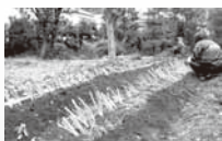
▲収穫時が楽しみです！

前号でお知らせした「野菜作り、畑仕事ボランティア」は、9 名の方々が集まりました。