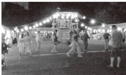
▲ 交流の終焉は盆踊りで！

ちよつと季節はすれですが、この夏に体験した、地域住民だけの、大きな夏祭りについての話しをします。この夏祭りは、30年ほど前に、鶯ノ木地区の自治会が「みんなで支えあい、助け合う地域」を目指して、地域住民による「夏祭り」として始まり、今では、鶯ノ木の7つの自治会の皆さんが一致団結により、協力して盛り上げています。 この夏祭りは、鶯ノ木愛宕神社（鎮守社）に奉納される、市の無形民族文化財「鶯ノ木囃子」を乗せた山車が地元の子ども達に曳かれ、2キロほどの道程を1時間半ほど、かけて、夏祭り会場に到着し、これを持って、夏祭りの本番がスタートします。途中の休憩所（4力所）では、飲み物、アイスクリーム等で、涼をとりながら、曳き手の子ども達と大人達の交流で祭りを楽しみ、一方、祭り会場では、盆踊りの櫓を囲むように自治会や民生・児童委員などの夜店が並び、本部席には、すこやか推進員による体力測定その他、寿会席（敬老専用席）も用意され、ヨーヨー釣りやゲームに興じる子ども達、盆踊りを楽しむ老若男女、そして、敬老席から、これらを眺めている、おじいさんやおばあさん、こころ和む、夏祭りの風情を見てください。