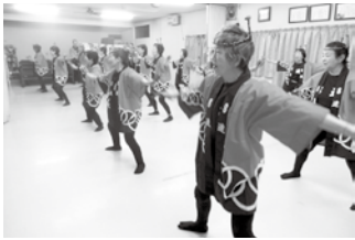
▲よさこいソーラン節フィナーレ