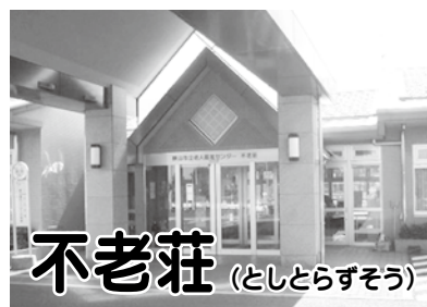
不老荘 (としとらずそう)