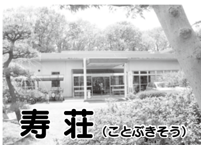
寿荘 (ことぶきそう)