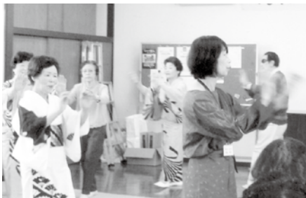
▲7月の盆踊り大会の予行演習も兼ねて踊る