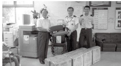
航空自衛隊入間基地より 座椅子寄贈の様子