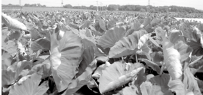
▲今年は豊作 広いさといも畑

今回は狭山に避難してきた福島原発被災者とのふれあいを予定するも急遽帰郷が決り、巨大ひまわり迷路のイベントに変更するも前日の大雨でこれまた中止…三度目の正直、狭山市農業祭が賑やかに行われることを期待しよう！