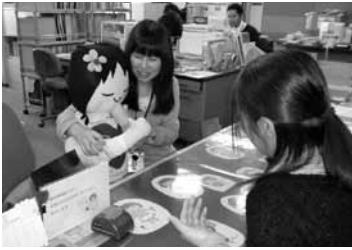
▲手話を教えてもらっちゃいました