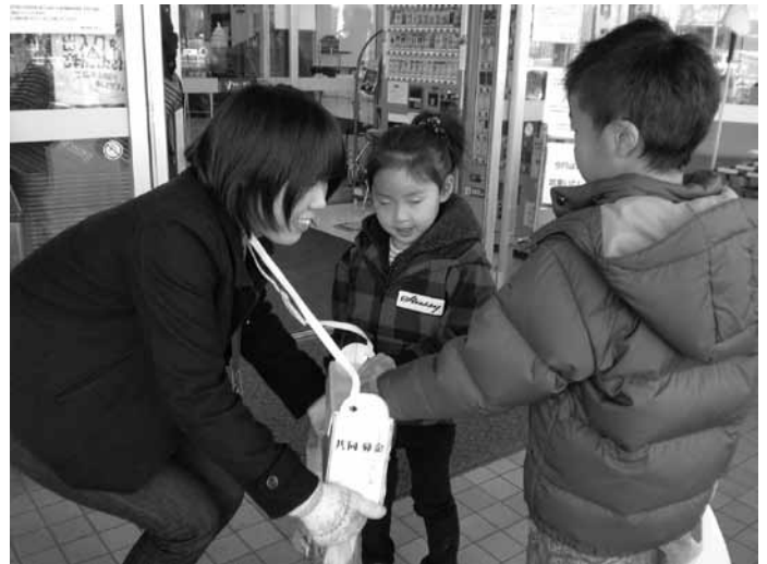
～社会福祉協議会 職員による街頭募金の様子～