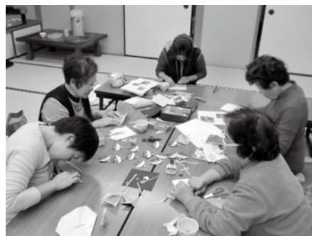
▲デイルームの様子

障がい者団体や在宅介護者団体、児童福祉団体等が実施する活動に対して助成金を交付しました。