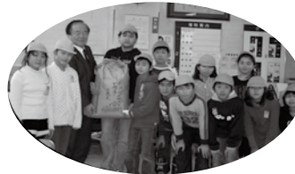
▲入間川東小学校5年生の皆様からお米を寄付していただきました。