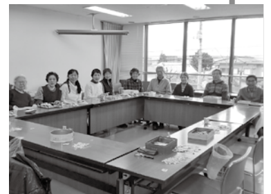
▲切手整理をするボランティアの様子