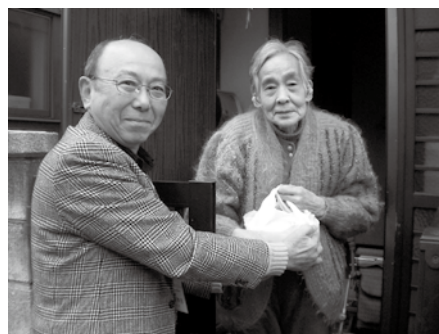
▲おせち料理宅配の様子