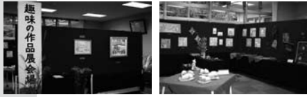
▲作品展示会の様子

作品展示会で飾ってあった作品も見るのが出来るかも……。皆さんのご来館をお待ちしています。