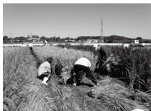
▲「あ・うん」の呼吸で稲刈りです