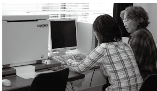
▲点訳物を作成している様子

点字に興味のある方、視覚障害者の方の支援をしたい方、 狭山市ボランティアセンターまでお問い合わせください。 TEL:04-2954-0294