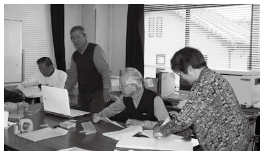
▲点訳物を校正しています