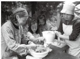
▲おいしそうなお餅ができたね