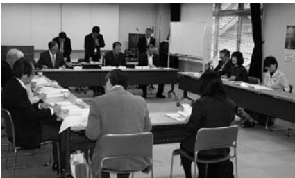
▲第1回策定委員会の様子

平成24年度から平成27年度までの4カ年における狭山市地域福祉活動計画を、支部社協や民生委員等の福祉関係者から推薦された方、一般公募により選ばれた方など計15名の委員の方とともに、全7回の委員会を経て策定していきます。