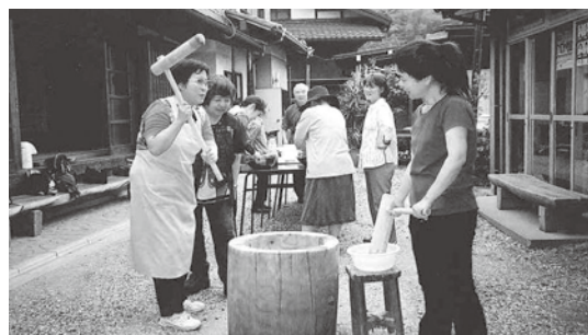
▲視覚障害者との交流会の様子