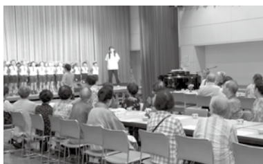
▲可愛い園児の歌声に大喜び