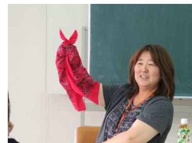
子どもの発達と関わり

預かる会員の皆様が安心して援助活動を行えるよう、厚生労働省の指針に基づき、9項目24時間の研修が設定されています。