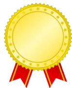
美咲作 七夕まつり