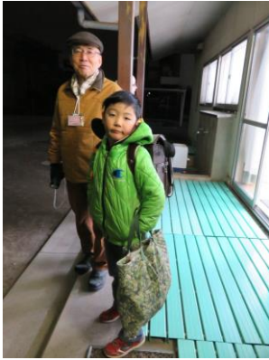
学童へお迎え。懐中電灯を持って出発！