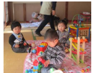
お母さんが受講中、となりの部屋で遊んでまっま〜す