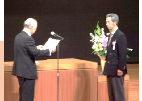
第一部式典のようす

サロン千年会 いなりやまフレンズ 狭山市すこやか体操普及指導員連絡会 青空の会 フレンズ NPO法人さやま涯学習をすすめる市民の会 ボランティアの止まり木 柏原の清流を復活させる会 狭山台地域づくりをすすめる会 橘幸月会 和太鼓「連」 おやじバンド ヒマヨリマシナスターズ 元気太鼓WA