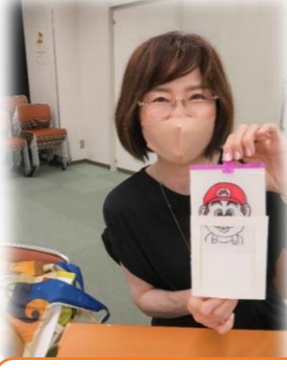
♪マジックカード作り 上手くできました♪