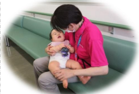
保護者が登録手続き中はお子さんをお預かりしますので、ゆっくりご相談できます♪