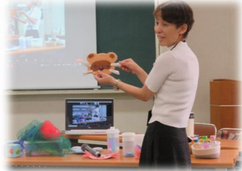
1.保育の心(講師:保育所職員) ※手作りおもちゃを紹介していただきました