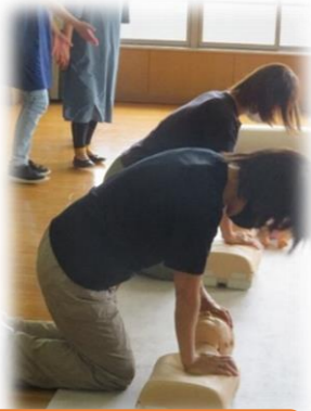
救命救急講習の様子

9項目のうち、必須項目である7項目を6、7月に行いました。1.保育の心、3.子どもの遊び、4.子どもの世話、5.子どもの事故と安全・幼児救命救急講習、7.心の発達とその問題、9.預かる会員の心得 また、冬にも同じ講座を開講予定です。