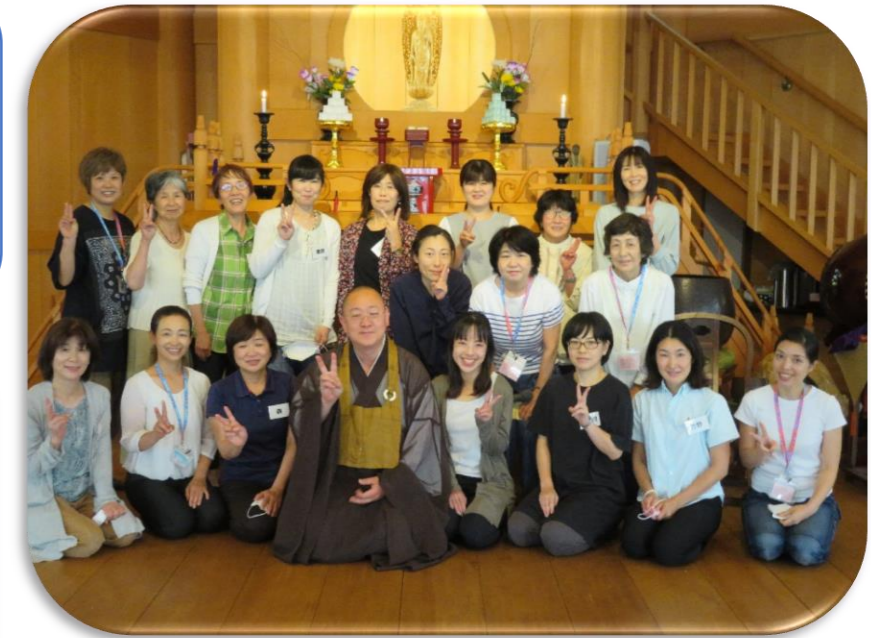
坐禅後のおしゃべりの様子♪ お菓子よりもおしゃべりに夢中でした。

坐禅を行うことで心の切り替えができる、スイッチ作りが大切だと学びました！ 日常でいつでもできると自動浄化作用になる、というご住職の言葉が印象に残りました♪