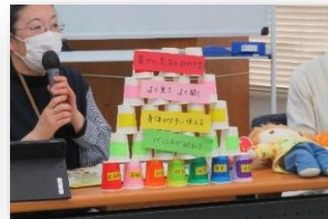
7.心の発達とその問題からだの育ちについて

9項目のうち、必須項目である7項目を1月に行いました。1.保育の心、3.子どもの遊び、4.子どもの世話、5.子どもの事故と安全、7.心の発達とその問題、9.預かる会員の心得全て終了しました。令和4年度延べ受講人数(zoom 含め)193名でした。新たに2名の預かる会員が援助可能になりました。