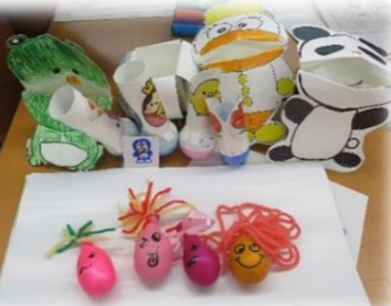
スクイーズ、パクパク人形、起き上がりこぼしができました♪