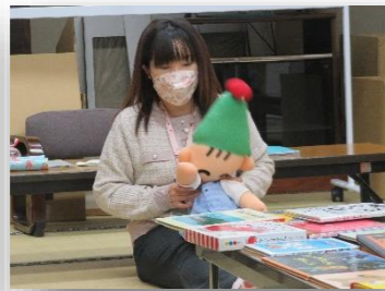
3.子どもの遊び 手遊び