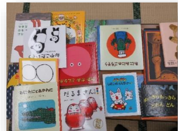
3.子どもの遊び 絵本の紹介