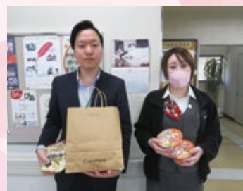
▲(株)ホンダカーズ埼玉西 U-Select狭山中央