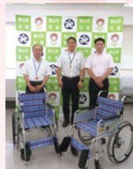
▲BBリサイクルパートナーズ