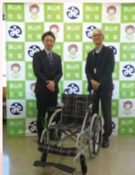
▲第一生命 労働組合 埼玉西支部