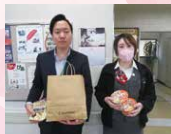
▲(株)ホンダカーズ埼玉西 U-Select狭山中央