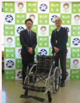
▲第一生命 労働組合 埼玉西支部