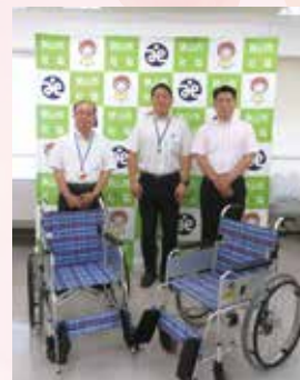
▲BBリサイクルパートナーズ