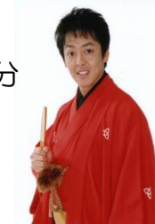
桂三若氏 (落語家/吉本興業所属)

申し込みは不要です。直接ご来場ください。 駐車場台数に限りがあるため、公共交通機関をご利用ください。