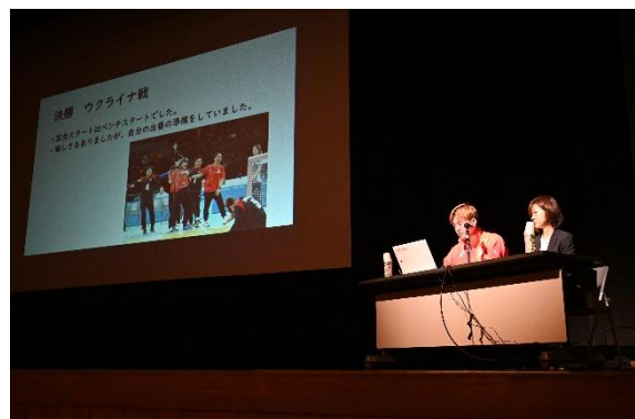
第2部 講演「俺の人生」