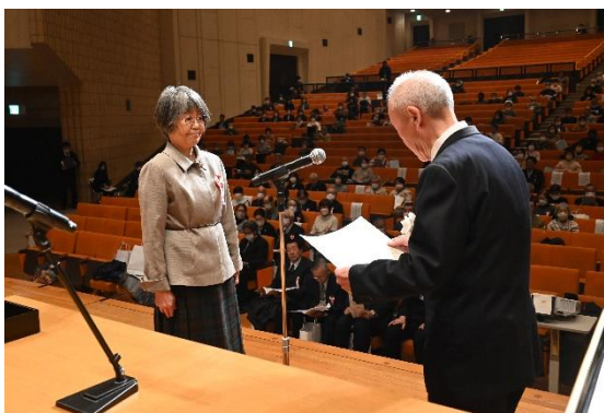
第1部 式典 表彰