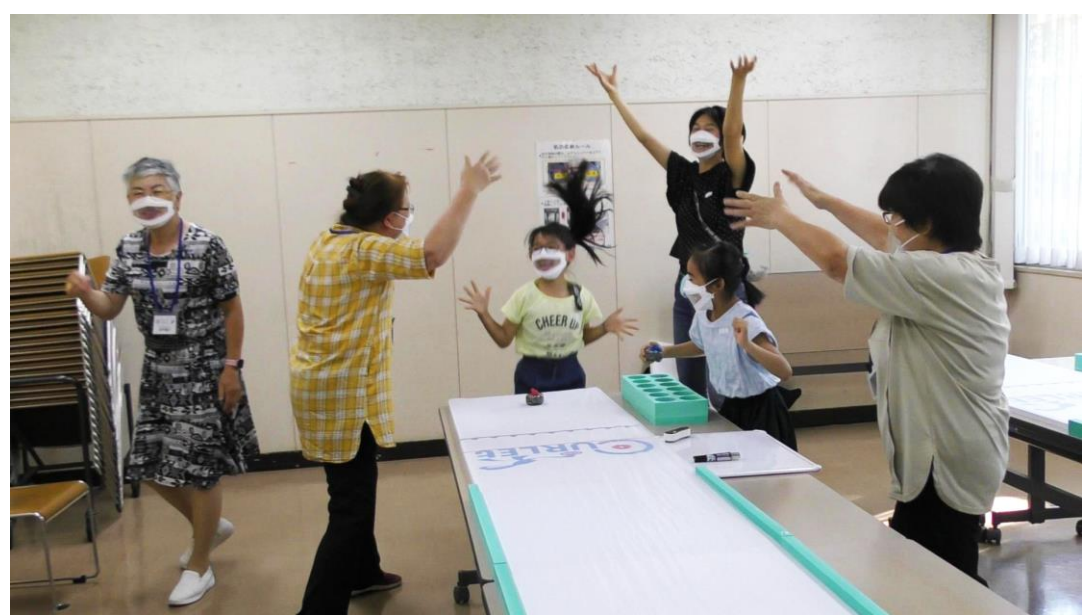
▲ 狭山カーレットクラブまぜこぜの活動写真

カーレットとはカーリングのミニチュア版で、子どもから高齢者、障害のあるなしに関わらず楽しめる、卓上で行うスポーツ（ゲーム）です。