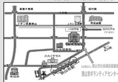
社会福祉会館地図