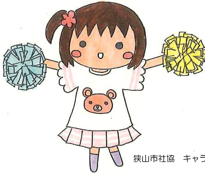
狭山市社協 キャラクター こころちゃん