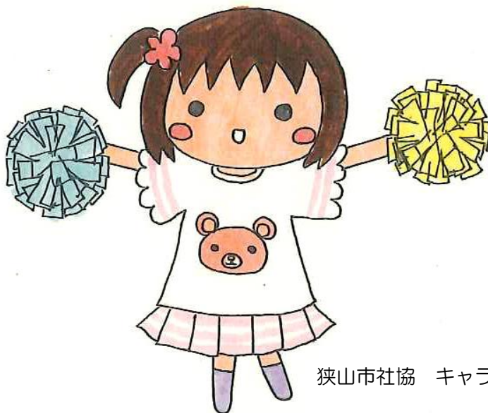
狭山市社協 キャラクター こころちゃん