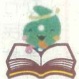
埼玉県社協マスコット 「シャキたまくん」