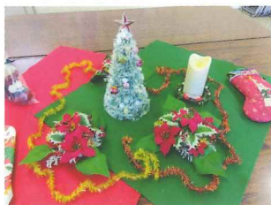
年末のクリスマスの飾付