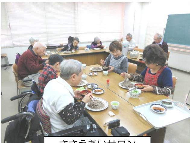
ささえあいサロン