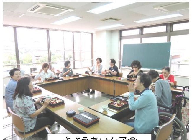
ささえあい女子会