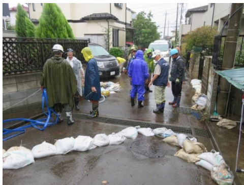
▲排水詰まりの除去