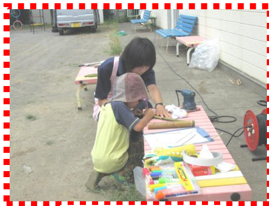
児童館での活動の様子