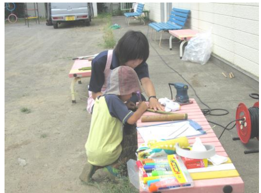
児童館での活動の様子