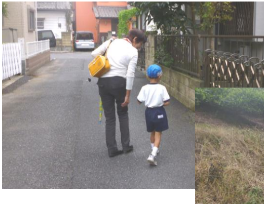
幼稚園へ出発！ 今日のお散歩の発見 は何かなあ・・・

月に何回か、お母さんの代わりにお子さんを幼稚園へ送り届けるお手伝いをしています。センターに届く報告用紙からも楽しいお散歩の様子が分かりますね(*^_^*)