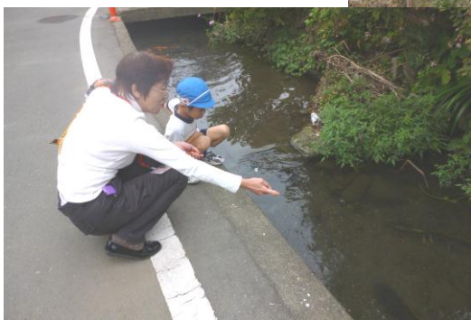
うわあ～ お魚がいっぱいだあ～