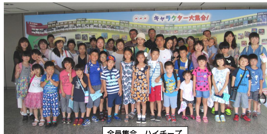
全員集合 ハイチーズ